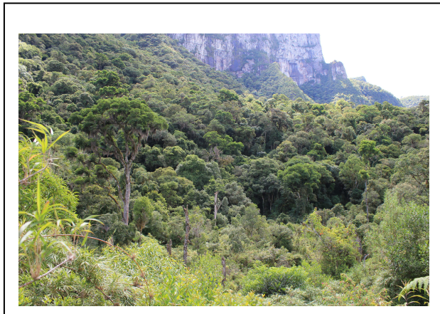
3. Vegetação da RPPN