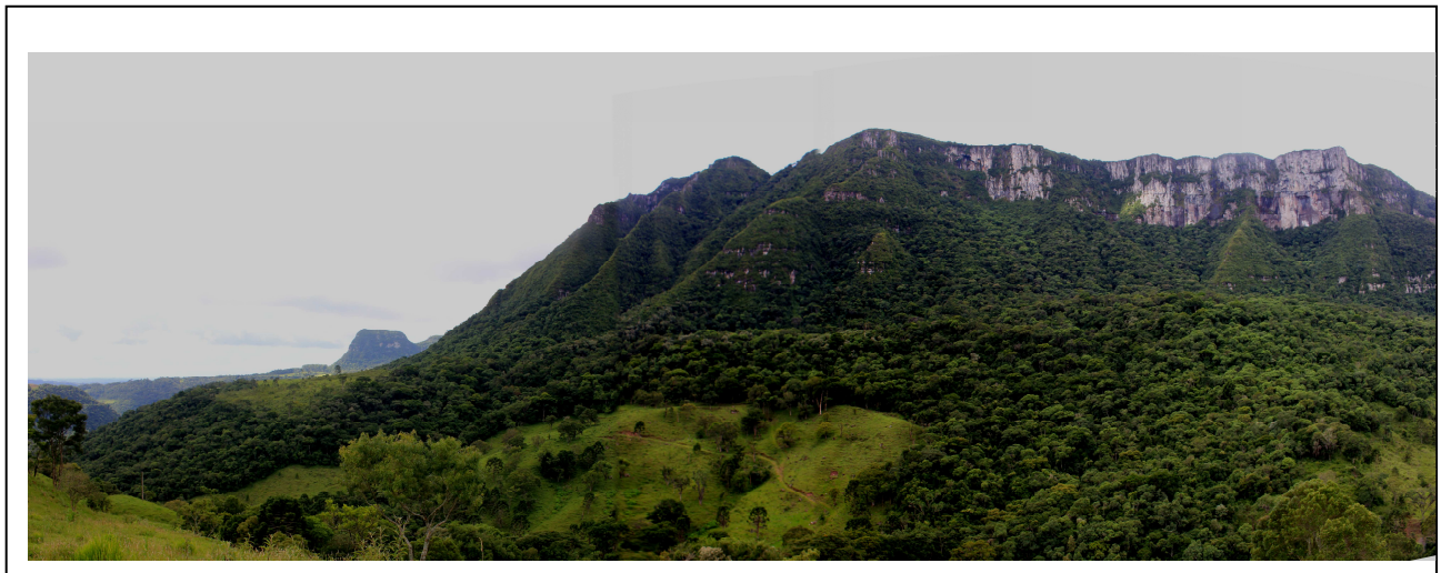
2. Vista Geral da propriedade, com a área de pastagem e floresta.