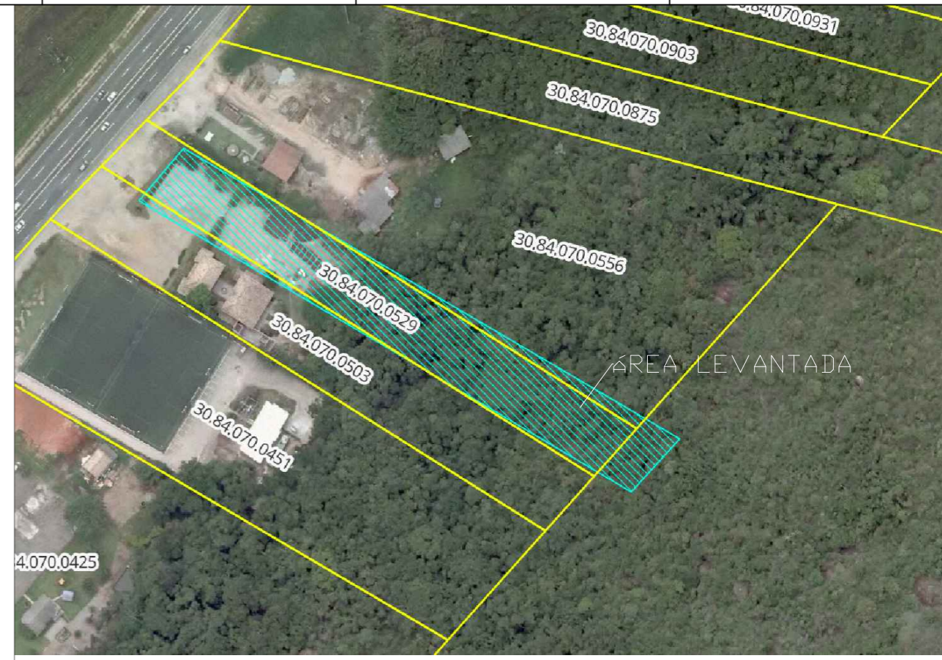
Ortofotom Municipal, gerado a partir da Base Cartográfica de 2016, IPUF - Instituto de Planejamento Urbano de Florianópolis.